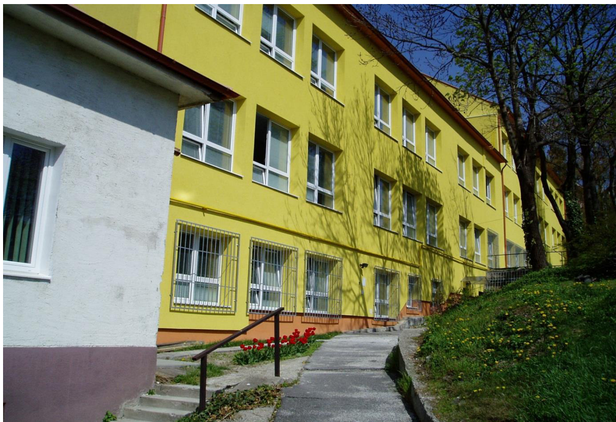
koncertná sála – Gorazdova 20